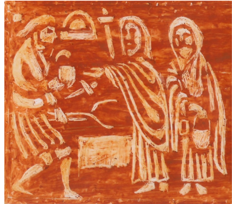
Dette billede er lavet efter et stykke af 'The Franks Casket', hvor sagnet om Vølund Smed er udskåret